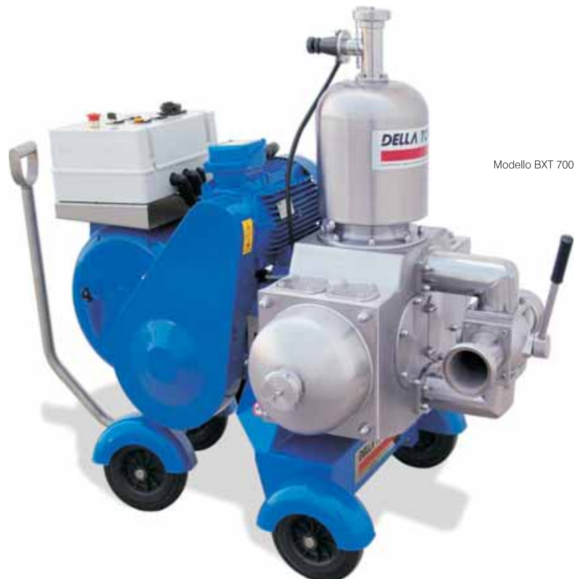
Modello BXT 700

En particular, BOMBAS MOHNO serie FTF para uva estrujada, BOMBAS MOHNO serie M para líquidos, BOMBAS DE PISTÓN INOX. y BOMBAS PERISTÁLTICAS.