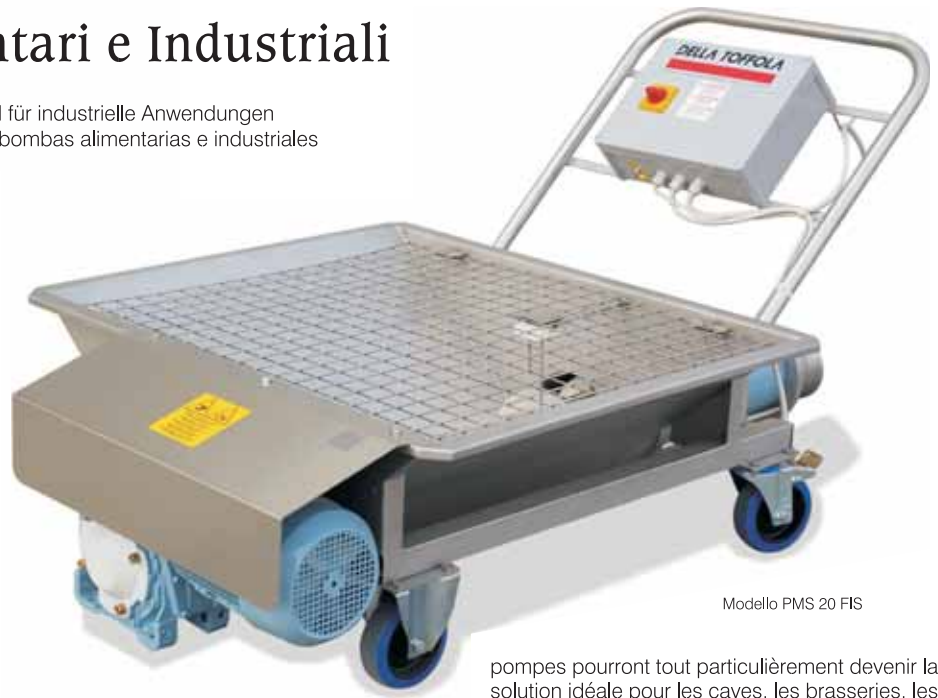
Modello PMS 20 FIS

L a Société Della Toffola, qui travaille depuis de nombreuses années dans le secteur de la mécanique et de l'usinage de l'acier inox, propose une vaste gamme renouvelée d'électropompes caractérisées par de fortes valeurs technologiques et de sécurité. Ces