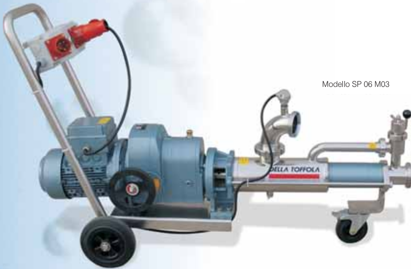
Modello SP 06 M03

H aving operated for years in the mechanics and processing of stainless steel, Della Toffola can offer a varied and up-to-date range of electric pumps characterized by excellent technological and safety features. These pumps are the ideal solution for wine cellars, fruit juice industries, beer breweries, distilleries and the beverages